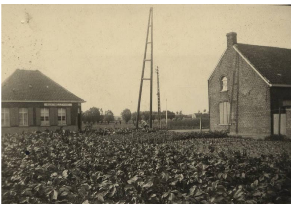
Rechts De Eendracht, links A La Belle Vue.