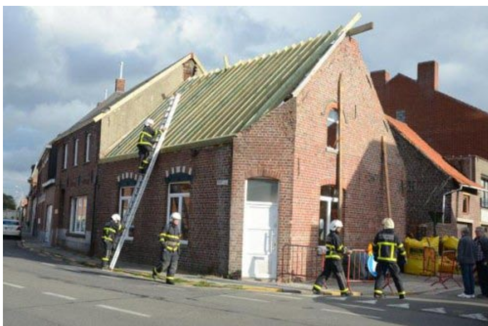
Tijdens verbouwingswerken enkele jaren geleden moest de brandweer te hulp komen omdat de topgevel op instorten stond.